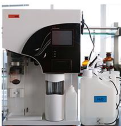
全自动凯式定氮仪