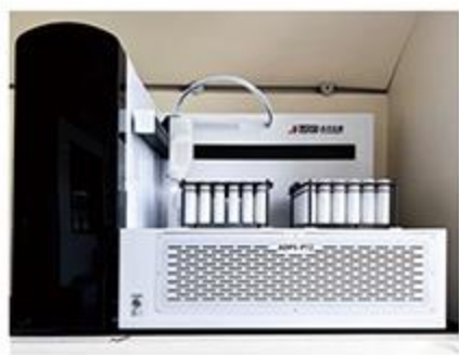
全自动石墨消解仪