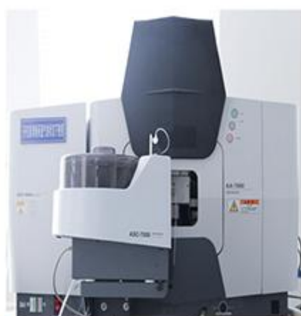
原子吸收分光光度计