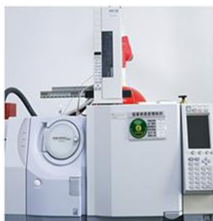
气相色谱-质谱联用仪

公司现有检测场所2500平方米，设置样品室、预处理室、有机实验室、无机实验室、土壤室、天平室、综合实验室、微生物实验室等；配备微波消解仪、水平振荡器、低速离心机、气相色谱仪、原子吸收分光光度计、石墨炉原子化、ICP、ICP-MS、全自动石墨消解仪、原子荧光光度计等大型先进仪器设备。所有仪器设备每年均进行检定或校准，并出具检定校准合格证书，全面保证检测数据的科学性、准确性。