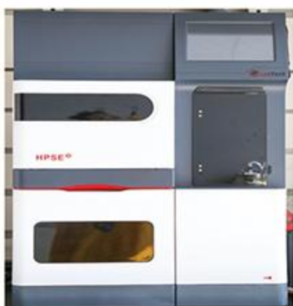
高效快速溶剂萃取仪